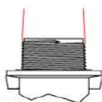
ISO 7/1 Conical

Filete: - exterior/conic - Interior/paralel